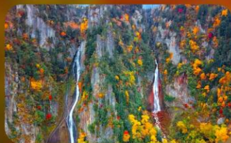
น้ำตกกิงกะ และน้ำตกริวเซ