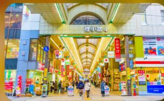
ซุปป์ิงถนนทากุโคจิ