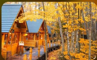
หมู่บ้านนิงเกิ้ลทอเรซ

SAPPORO TOKYU REI หรือเทียบเท่ามาตรฐานญี่ปุ่น