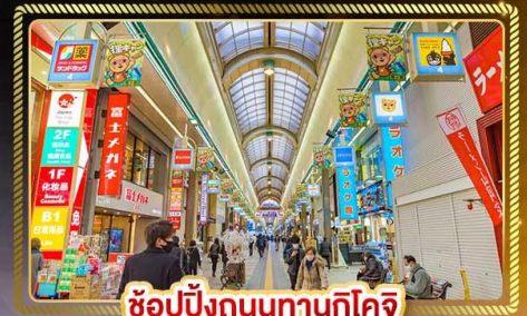
ช้อปปิ้งถนนทานุกิโคจิ