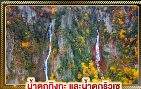
น้ำตกทิงกะ และน้ำตกริวเซ