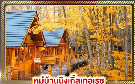
หมู่บ้านนิงเกิ้ลทอเรซ